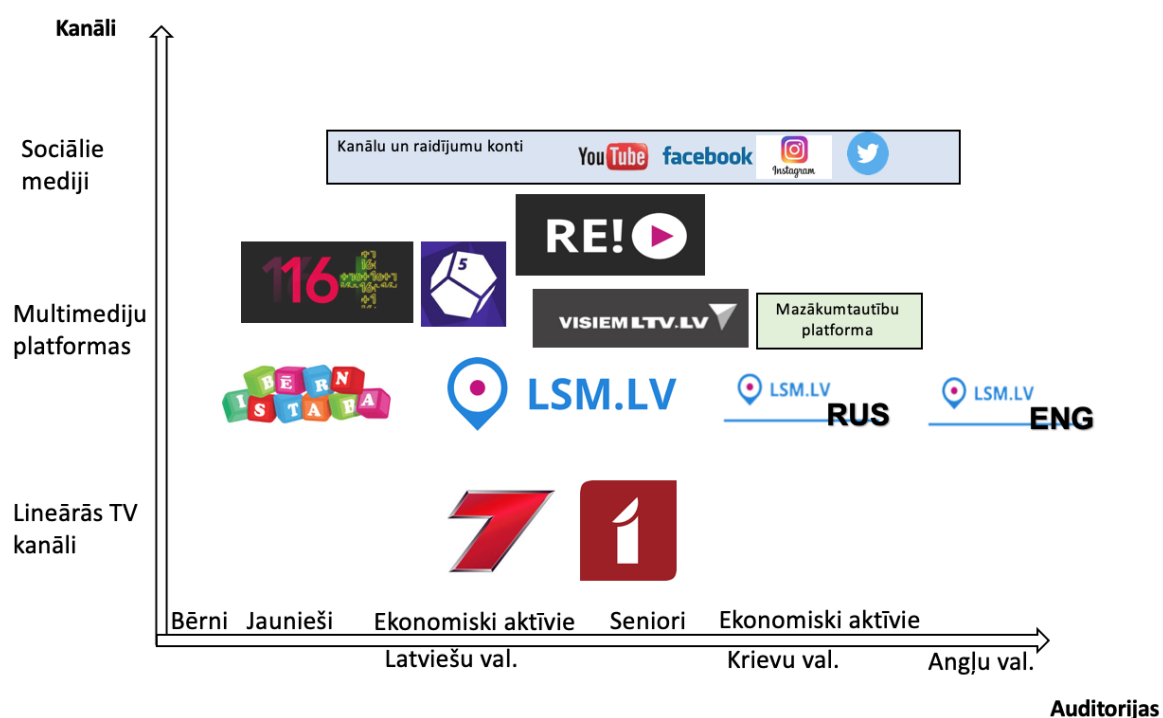
Grafiks Nr.2. LTV kanālu un auditoriju karte